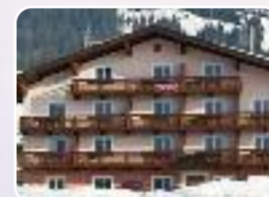
Wilder Kaiser 2