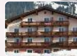
Wilder Kaiser 2