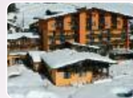
Wilder Kaiser 1