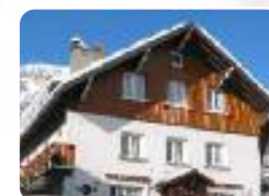
Les Deux Alpes