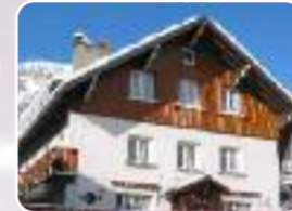
Les Deux Alpes