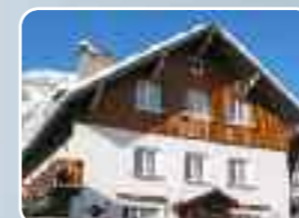
Les Deux Alpes