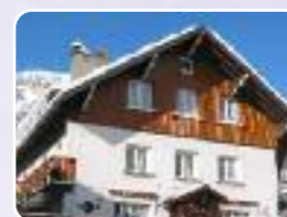
Les Deux Alpes