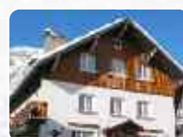
Les Deux Alpes