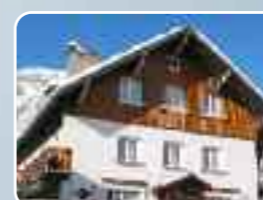
Les Deux Alpes